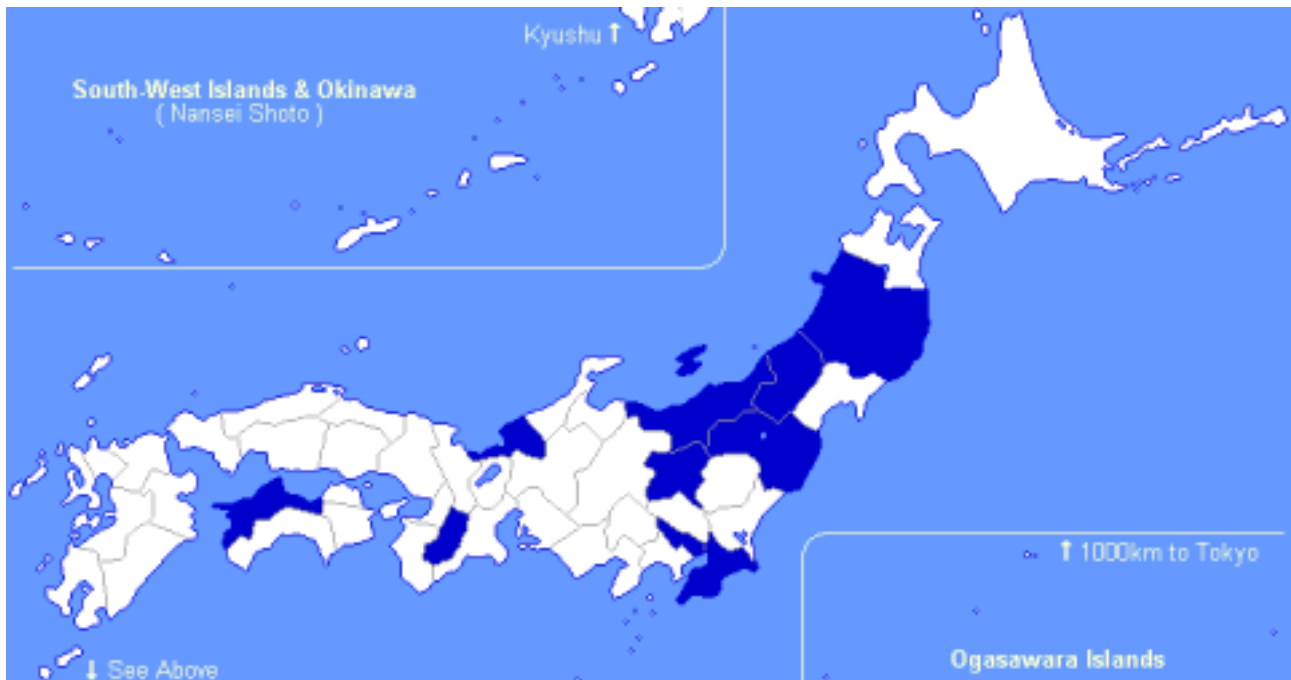
図-1 相談自治体の分布 2)

相談内容としては、路線バス撤退に伴う公共交通計画の策定、デマンドバス、市町村合併に伴う公共交通計画の策定、コミュニティバスなどとなっている。相談のほとんどのきっかけとなっているのが赤字路線バスの撤退と市町村合併であり、バス110番開設の背景と整合していることが理解できる(図-2)。